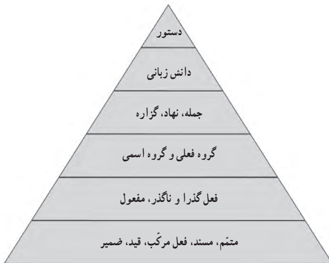
ساخت شناختی فرد از زبان فارسی

با این روش، از کل به جزء یا از مفاهیم به مصداق می‌رسند (قیاس).